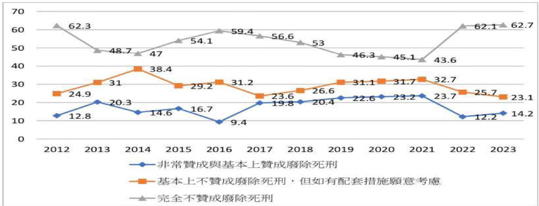
圖 5 中正大學犯罪研究中心調查民眾對於廢除死刑意向趨勢圖 3