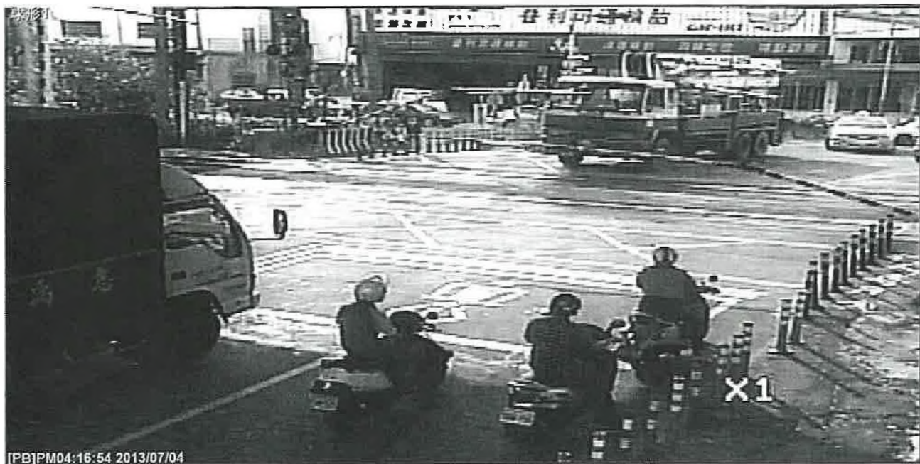
西南側遮斷桿遭撞擊