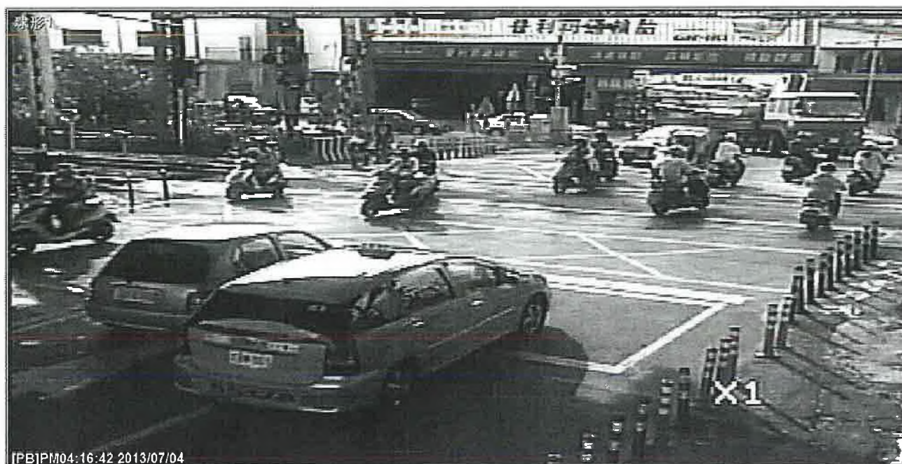
下行列車接近，平交道警報開始(警鈴、閃光燈正常作用)