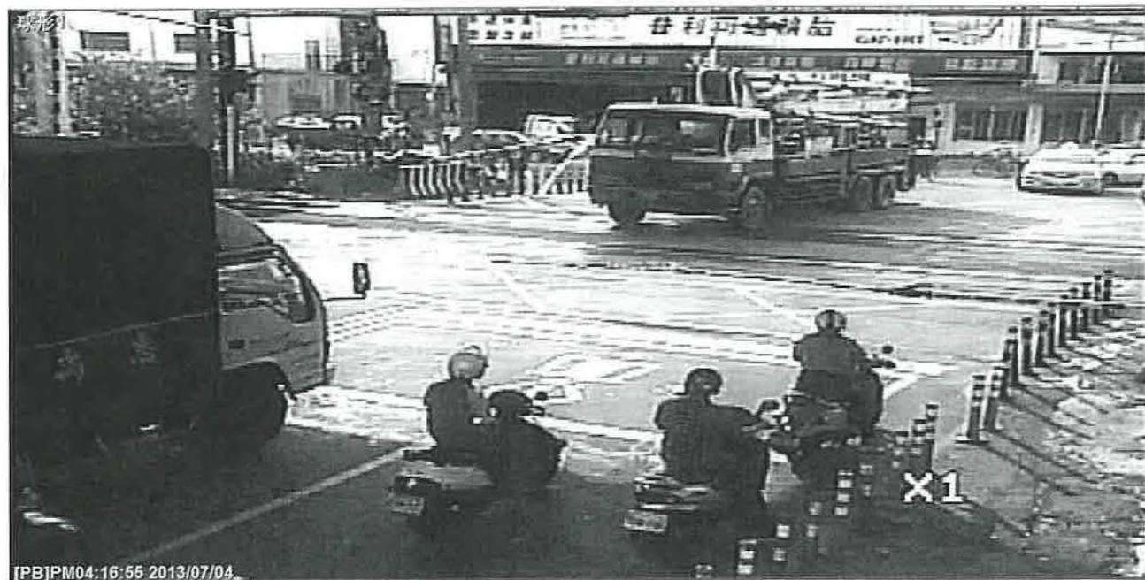
入口側遮斷桿放至水平